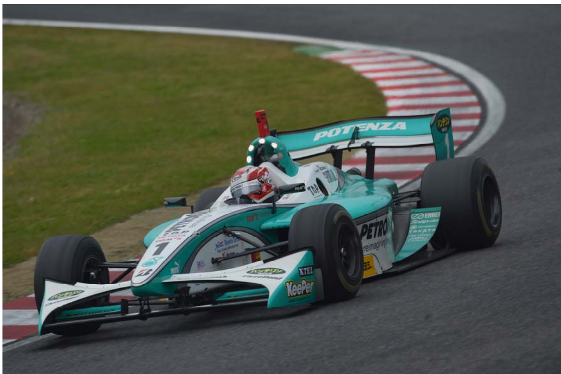
Race 2 優勝 #1 中嶋 一貴 (PETORONAS TEAM TOM'S)